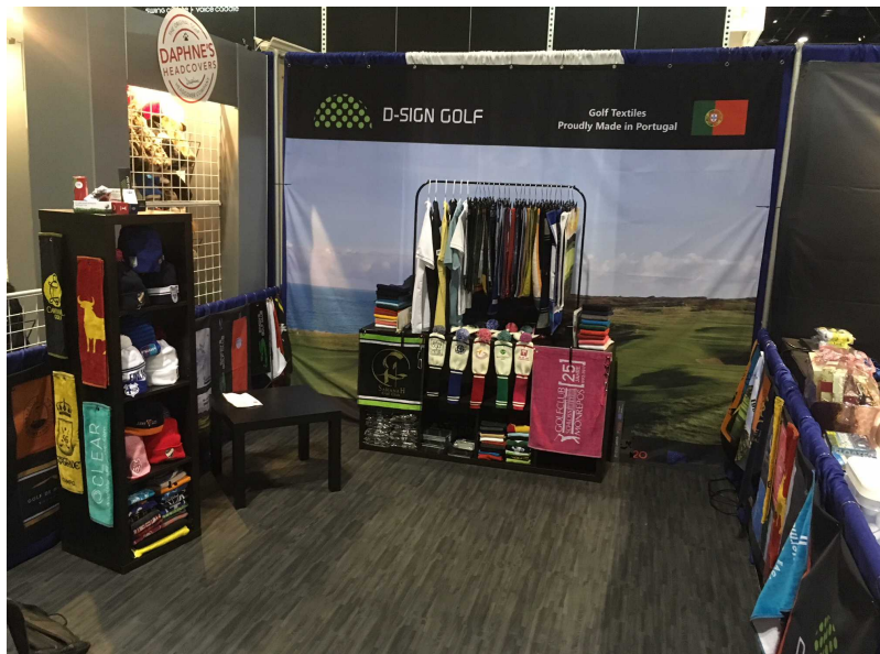
Janeiro 2018 – Stand 2104